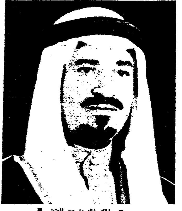
الملك خالد بن عبد العزيز